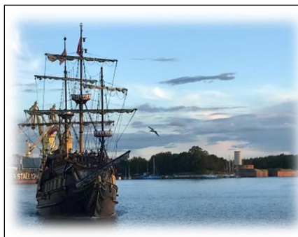
Călătorie cu corabia pe râul Martwa Wisla.