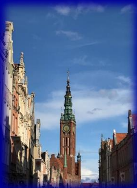
Admirăm centrul istoric al orașului