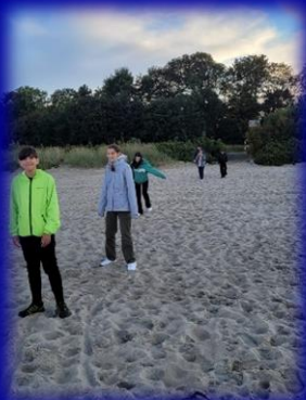
Imagine de plajă. Prima seară