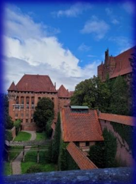
Vizităm Castelul Malbork împreună cu elevii și profesorii polonezi.

Luni seara am ajuns în Chojnice. Eram entuziasmați, așteptam cu nerăbdare următoarea zi, în care aveam să facem cunoștință cu elevii polonezi și aveam să vizităm școala acestora, o școală catolică.